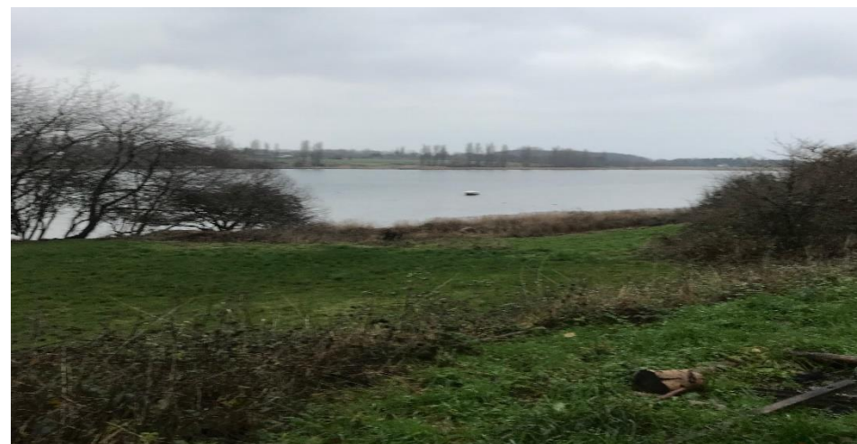
Udsigt fra lejrpladsen december 2018